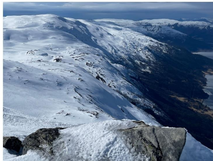
Holsnipa med utsikt mot Snøheia.

Av Helge Hatlestad, Sivilingeniør og pensjonist, Stavanger